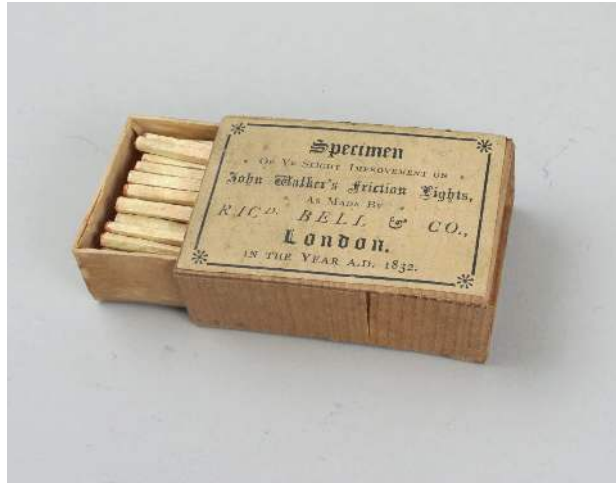
Figura 5: Las cerillas "Friction Lights"