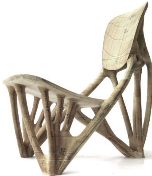
Figura 3: Silla Bone de papel