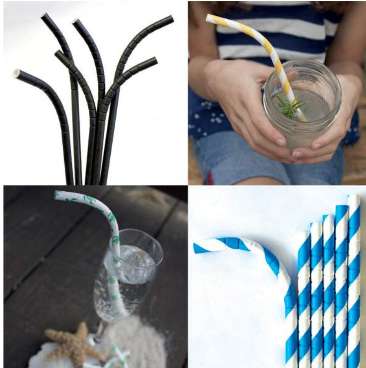
Figura 2: Paja Eco-Flex