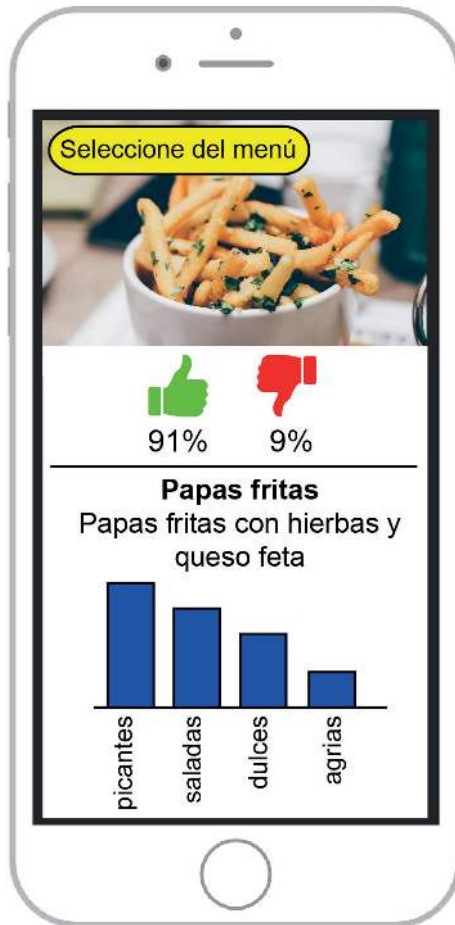
Figura 1: App Tasty